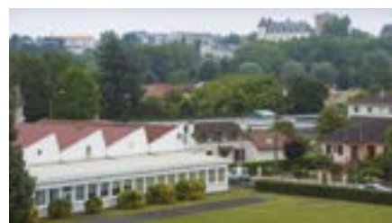
➤ Le Lycée des métiers de l'Habitat et de l'Industrie de Pau-Gelos (64).

Le SFECE, partenaire de cette formation, soutient les lycées souhaitant proposer ce cursus en prenant notamment en charge les frais de formation des professeurs intéressés.