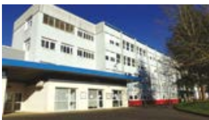
➤ Le Lycée Professionnel Chardeuil à Coulaures (24).

Ce diplôme, équivalent au niveau 3 (CAP), vise à développer des compétences spécifiques telles que le montage, le démontage, la modification et la vérification d'échafaudages fixes ou roulants, tout en respectant les règles de sécurité et de prévention de la santé, sous la supervision de la hiérarchie. Cette formation initiale, portée par l'Éducation Nationale, est accessible aux lycées professionnels et aux CFA. À la rentrée scolaire de septembre 2025, les deux établissements ci-dessous ouvriront une classe dédiée.