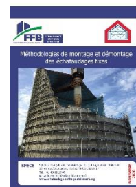
Guide de méthodologies de montage et de démontage des échafaudages fixes