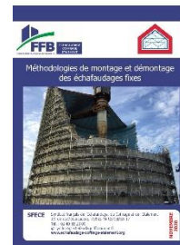
Guide de méthodologies de montage des échafaudages fixes